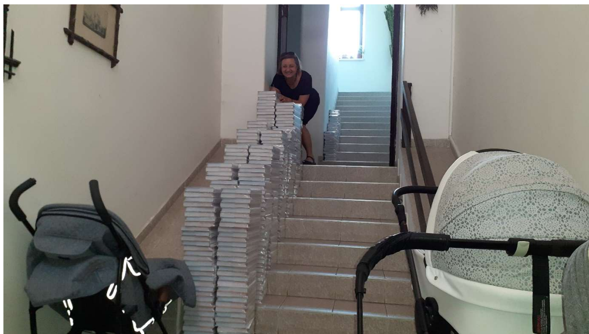
Obr. 10: Je 29. června 2022. Čerstvě vytištěné knihy jsou doma!

Poprvé jsem uviděla svůj splněný sen. Z tiskárny právě přivezli vytištěné knihy „Co nás učí nádory. Paralely v chování buněk a lidí.“ Polovina nákladu k mé velké radosti skončila u nás v domě ( obr. 10 ).