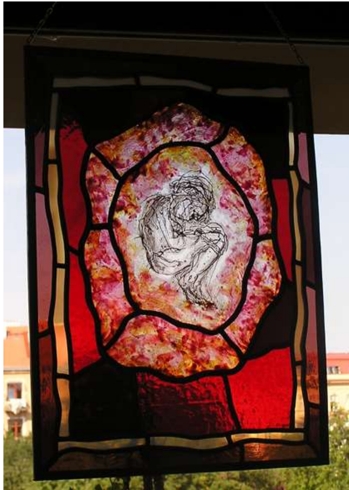
Obr. 5: Vitráž inspirovaná obrazem: dárek mých kolegů z Ústavu patologie FN Brno k mým padesátinám.