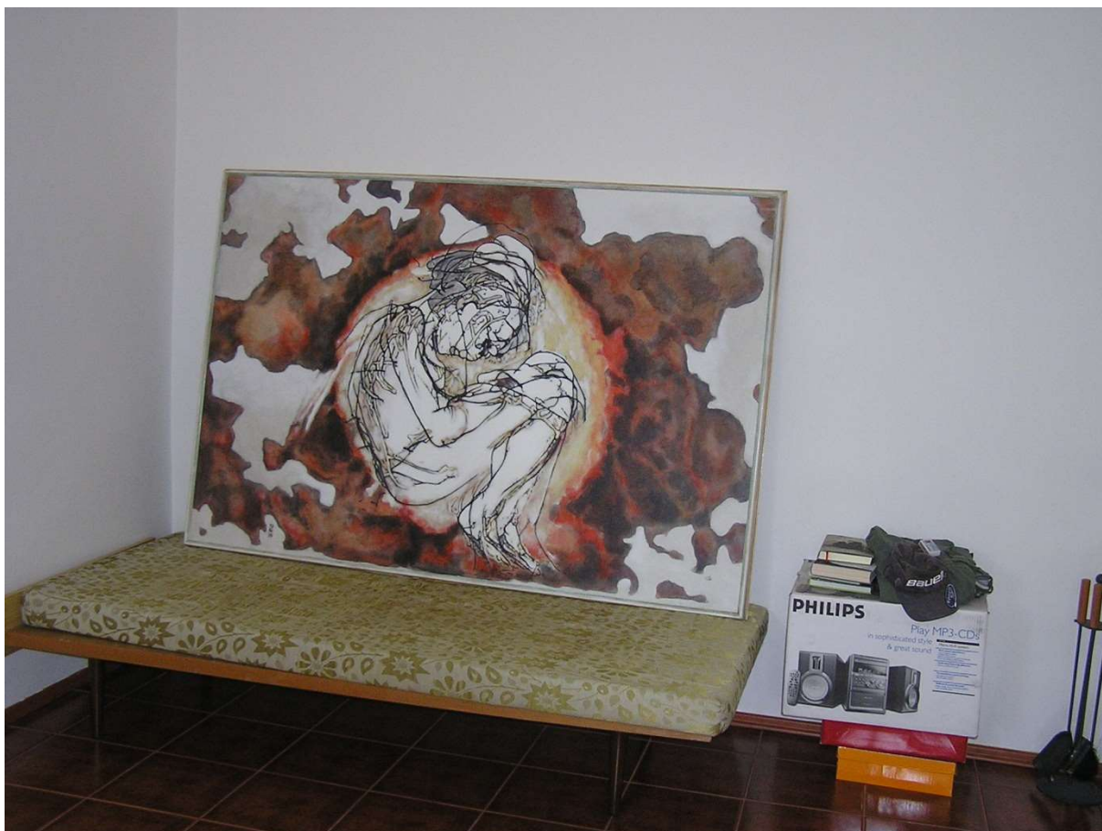
Obr. 9: Obrázek právě doputoval do svého nového domova v Moravské Nové Vsi: 28. 10. 2014, 15.15 hod.