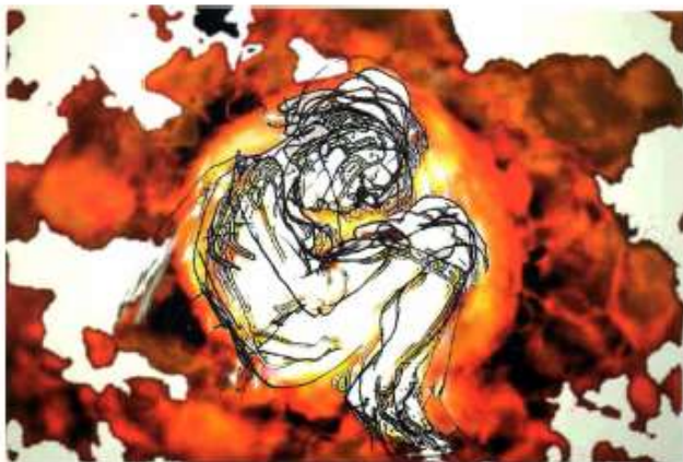
Obr. 1: Přesahy. Osteoklast, tj. buňku, která se podílí na odbourávání kostní hmoty, nafotil a její cytoskelet obarvil Pierre Jurdic (Francie), jako východisko pro svou kresbu použil Pierre Favre (Švýcarsko).

V jednom stručném přehledu pro akademickou obec jsme před časem s manželem popsali pohled biologů na to, jak vznikají nádory. Tímto textem chci na náš předchozí text navázat a hlavně se pokusit ho rozšířit právě o ty pohledy, které přicházejí nově, tj. o přesahy.